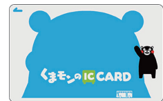
熊本地域振興ICカード (愛称:くまモンのIC CARD) ©2010熊本県くまモン#K20348

ICカードは、熊本県内の交通事業者5社が運営するバス、鉄道の共通交通乗車券として利用できるほか、商業加盟店で電子マネーとしても利用できる。