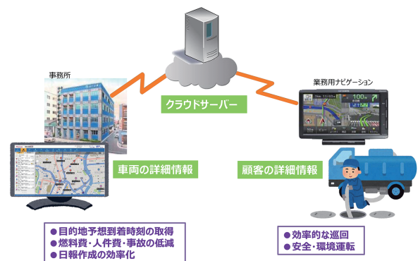
システム概要説明図