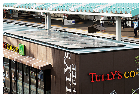
公共・産業用太陽光発電システム