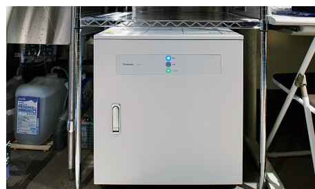
リチウムイオン蓄電システム