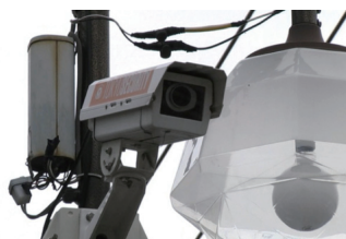
<商店街に設置された監視カメラ>

パナソニックグループであるヴィ・インターネットオペレーションズ(株)製の統合監視システム「ArgosView」をベースに、カスタマイズ。マルチベンダーカメラ対応機能として、パナソニック製のみならず、他社製のネットワークカメラ(最大10,000台規模)をも統合管理可能とした。また、遠隔画像監視により各地点のカメラの稼働監視や画像管理等の保守業務を代行する「オンライン画像監視サービス」が提供可能となり、エンドユーザの運用負担軽減につなげることができた。