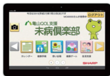
タブレット端末イメージ

4G通信機能と専用パッケージシステムを搭載したタブレット端末・クラウド連携により、健康管理・介護予防・生活支援の各サービスを提供。さらにコールセンターによる健康電話相談対応や地域シルバー人材センターに登録された生活支援サポーターによる訪問対応により、高齢者が安心してサービスを利用できる。人と人との直接コミュニケーションによるサポートを併せ、地域企業も参加したサステナブルな事業モデルを確立している。