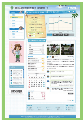
五農高アグリコミュニティ 作業日誌