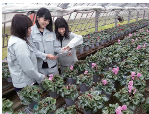
タブレット端末による作業風景