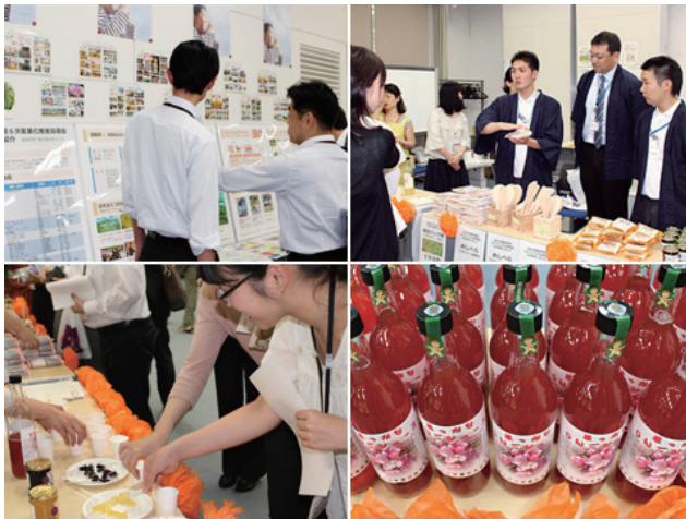
五所川原農林高校産品の販売会の模様